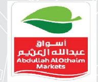
أسواق عبدالله العثيم