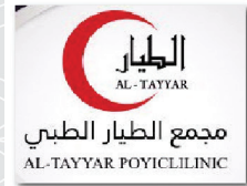
مجمع الطيار الطبي