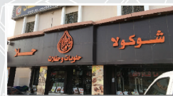
شوكولا حلا للحلويات