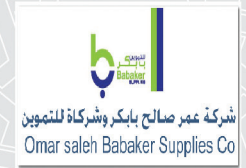
شركة عمر صالح بابكر للتأمين