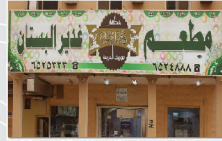
مطعم غدير البستان