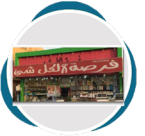
فرصة لكل شيء