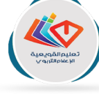
إدارة تعليم القويعة