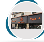
شوكولا حلا للحلويات